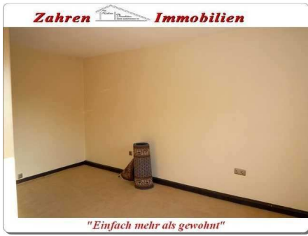
Schlafraum 2 OG