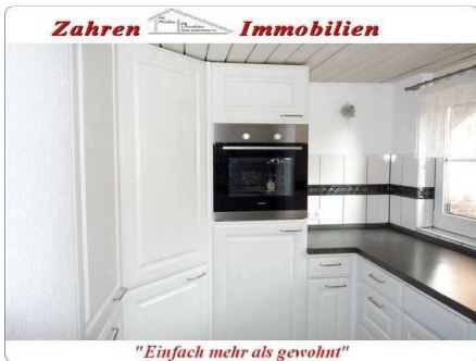
Küche Bild 2