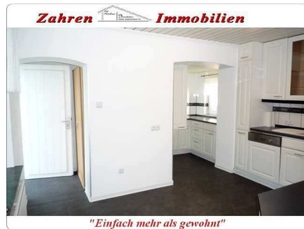
Küche Bild 3