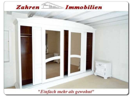
Schlafraum 3 Bild 2