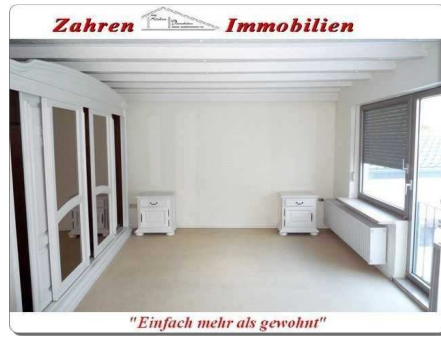
Schlafraum 3 OG