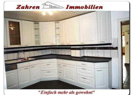
Küche Bild 1