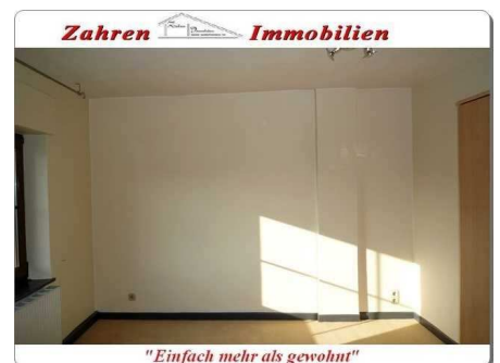
Schlafraum 1 OG